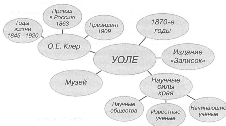
Рис. 10. Уральское общество любителей естествознания

Грозди – графический прием в систематизации материала. Правила очень простые. Рисуется модель солнечной системы: звезда, планеты и их спутники. В центре звезда – это тема урока, вокруг нее планеты – крупные смысловые единицы, затем планеты соединяются прямой линией со звездой, у каждой планеты свои спутники, у спутников свои.