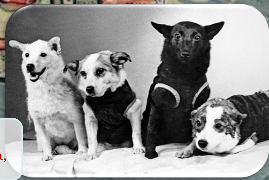
Собаки-космонавты (слева направо): Белка, Звездочка, Чернушка и Стрелка, 1961 год.